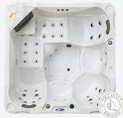
Nordenspa OTTA 45 JETS

För den optimala komforten är modellserien utrustad med en bred variation av både loungesäten i viloposition, ergonomiska sittplatser och en rogivande ljusupplevelse. Jetstrålarna och massageprogrammen bjuder på den mest välgörande och behagliga upplevelsen, på alla platser. Och med Nordenspas effektiva system för ozonrengöring får spaägarna ett betydligt smidigare ägande, som dessutom blir extra tryggt med frostvakten.