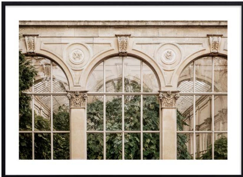
Poster ovan vänster: Overgrown figure 50x70. Poster ovan höger: Grand Orangery 50x70 Bild på höger sida: Annica Wallin, Executive Creative Director hos Desenio.

A ven om du trivs i ditt hem så kan det ju vara trevligt med lite omväxling ibland. Något nytt som piggar upp, utan att du behöver renovera eller ens möblera om. Då är en ny tavelvägg med posters ett alternativ som är både smidigt och prisvärt.