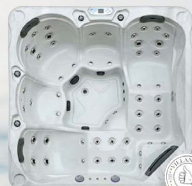
Nordenspa MOLDE 57 JETS