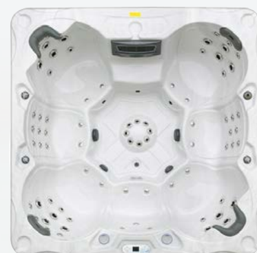
Nordenspa ALNES 71 JETS