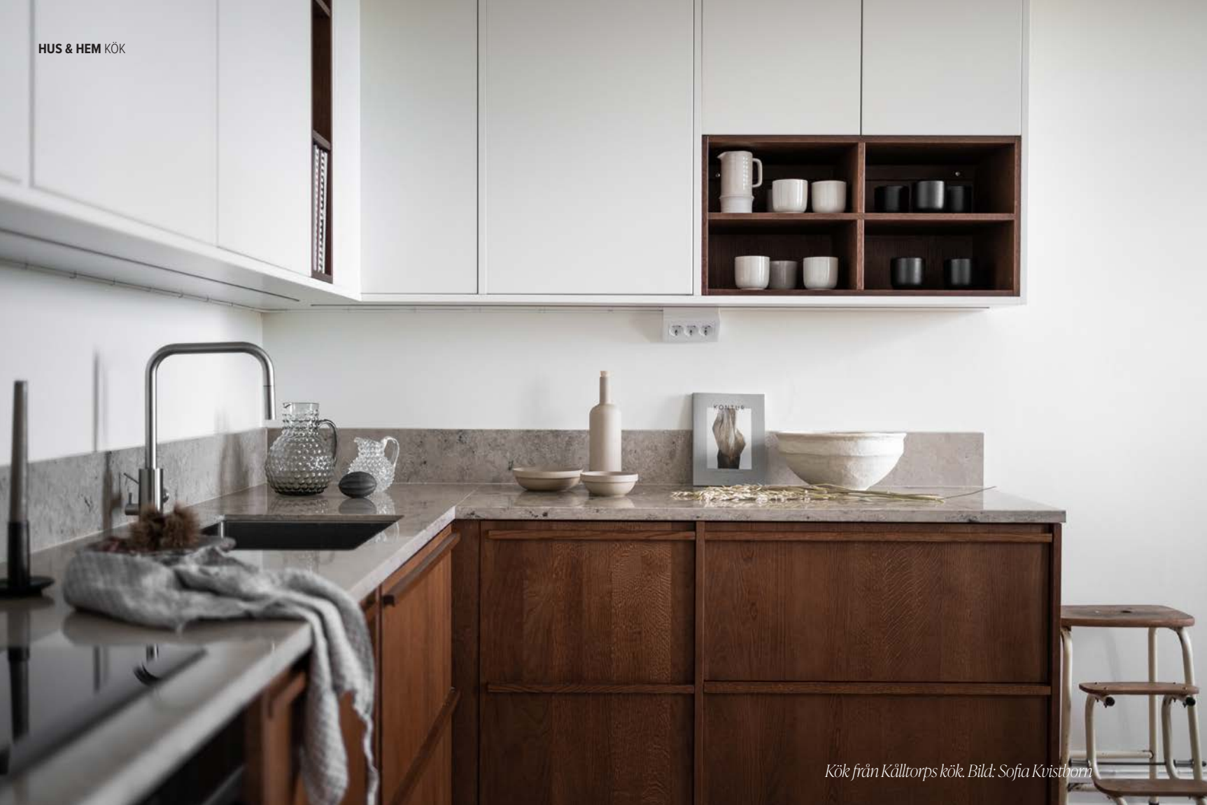
Kök från Källtorps kök.

F örst: Vad menas med ett kök i massivt trä?