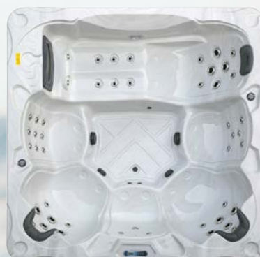
Nordenspa STRANDA 58 JETS