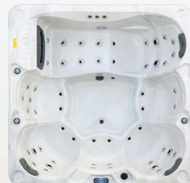
Nordenspa GISKE 44 JETS