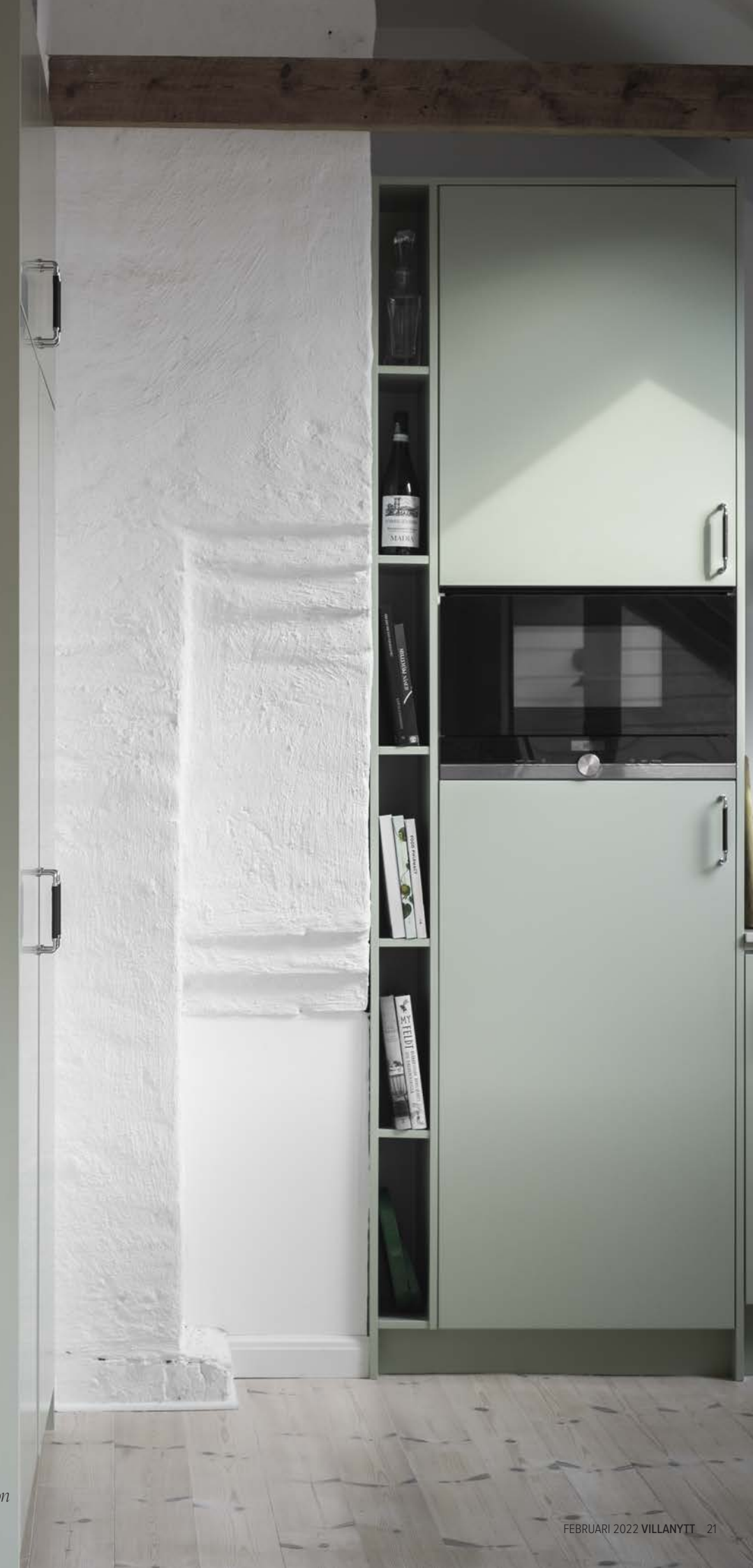
Kök från Källtorps kök.

– Alla våra lådor har fullutdrag med mjukstängning och går och välja i de flesta träslag. På så vis har vi förbättrat de gamla originalen kan man säga.